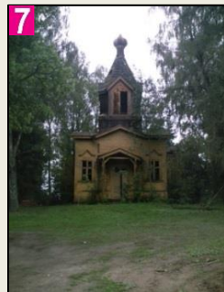
Menistes muzeja pagalms