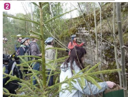
Skats pie Vecā Uskanu karjera

2. Vecais Uskanu karjers - karjers ir sena dolomīta ieguves vieta Apes novadā. Šeit sastopams arī rupjkristāliska dolomīta paveids – apīts. Dolomīta slāņu virsmā labi redzamas ledāja atstātās pēdas. Karjers ir aizsargājams ģeoloģiskais dabas piemineklis. Ir izveidots arī jaunais karjers „Ape”, kas apskatāms tikai iepriekš saskaņojot ar karjera vadību.