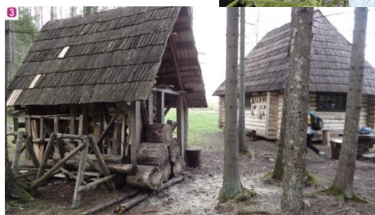
Atpūtas vieta Igaunijas galējā dienvidu punkta dabas takā

3. Igaunijas dienvidu daļas tālākā punkta dabas taka – taku 2003. gadā izveidoja vietējais mežsargs. Kājāmgājēju taka sākas pie Nahas saimniecības, tās kopgarums ir 4.8 km (taka ir izbraucama ar velosipēdu, vienīgi jāuzmanās no koku saknēm, kuras slapjā laikā ir slidenas, tādēļ mazāk pieredzējušiem braucējiem vēlams nokāpt no velosipēdiem). Daudz informācijas stendu, kas vēstī par vietējām dzīvnieku un augu sugām. Takas malā pie Igaunijas tālākā dienvidu punkta ir izveidota atpūtas vieta.