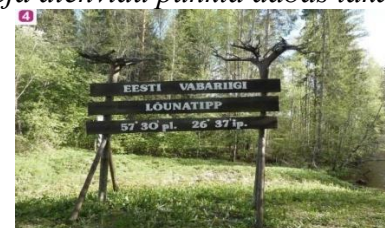
Skats pie Igaunijas galējā dienvidu punkta

4. Igaunijas galējais dienvidu punkts – pie Nahas saimniecības sākas aptuveni 4.8 km gara dabas taka, kura virzās gar Melnupi, kas vienlaicīgi šajā posmā ir arī Latvijas un Igaunijas robeža. Ģeogrāfiski precīzs Igaunijas Republikas tālākais dienvidu punkts atrodas tieši Peetri (Melnupes) upes vidū. Upes labajā krastā pie takas pieejams atpūtas namiņš, telts vietas, apskatāmi informācijas stendi.